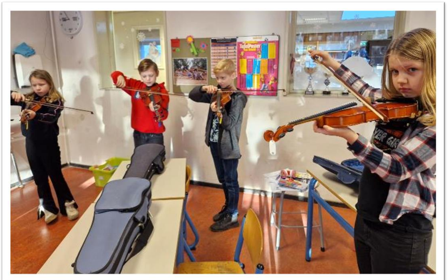
Groep 5&6 hebben het geluk dat ze ieder schooljaar twee keer een snelcursus krijgen op een muziekinstrument tijdens het project "De instrumentencarrousel".