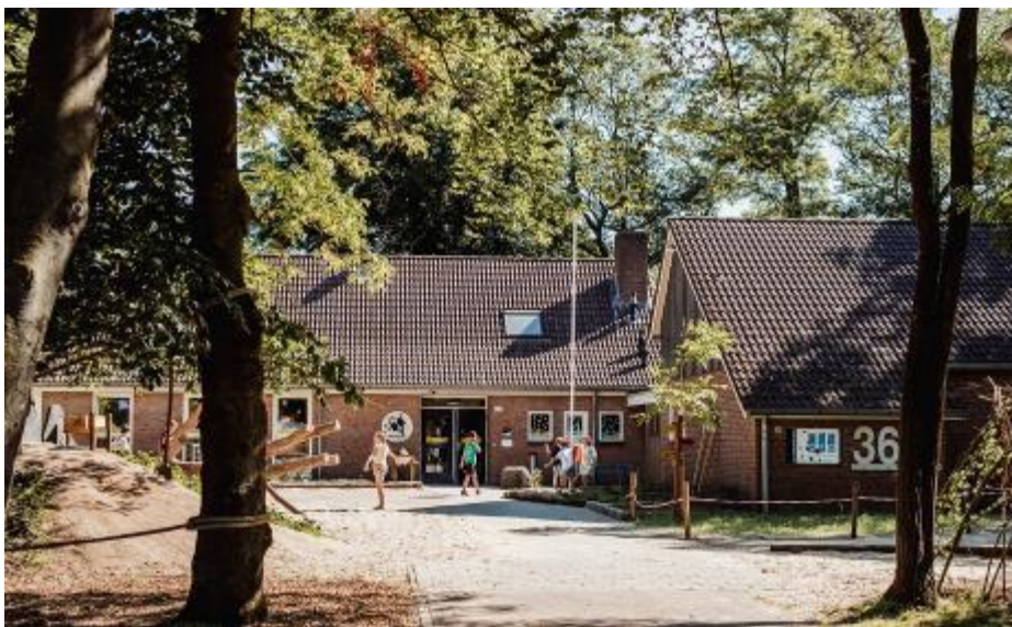
Tussen de bomen verscholen in de buurtschap Herike-Elsen...

Elserike draait met 4 combinatiegroepen en 9 personeelsleden. Onze school heeft als motto: "De opbrengst? Dat ben ik!"