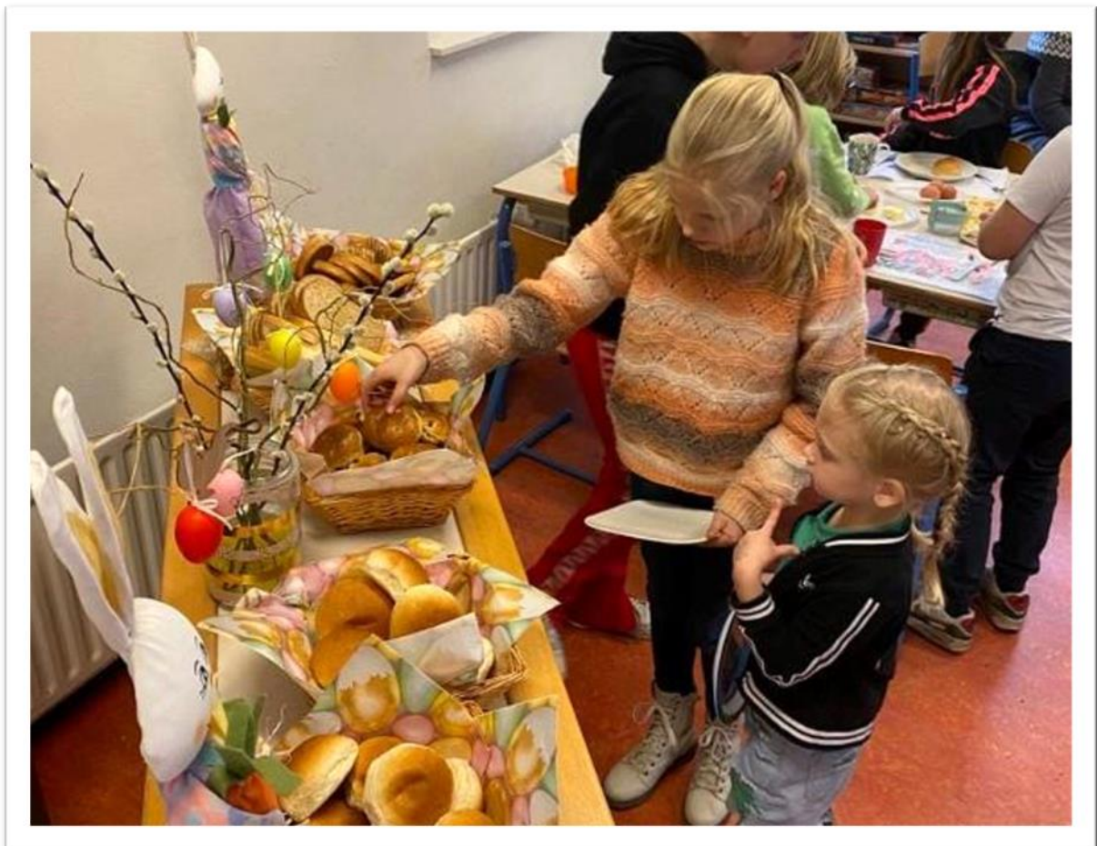
Paaseieren zoeken, de paashaas op bezoek en een geweldige paaslunch samen met alle leerlingen op school: de paasviering op Elserike.