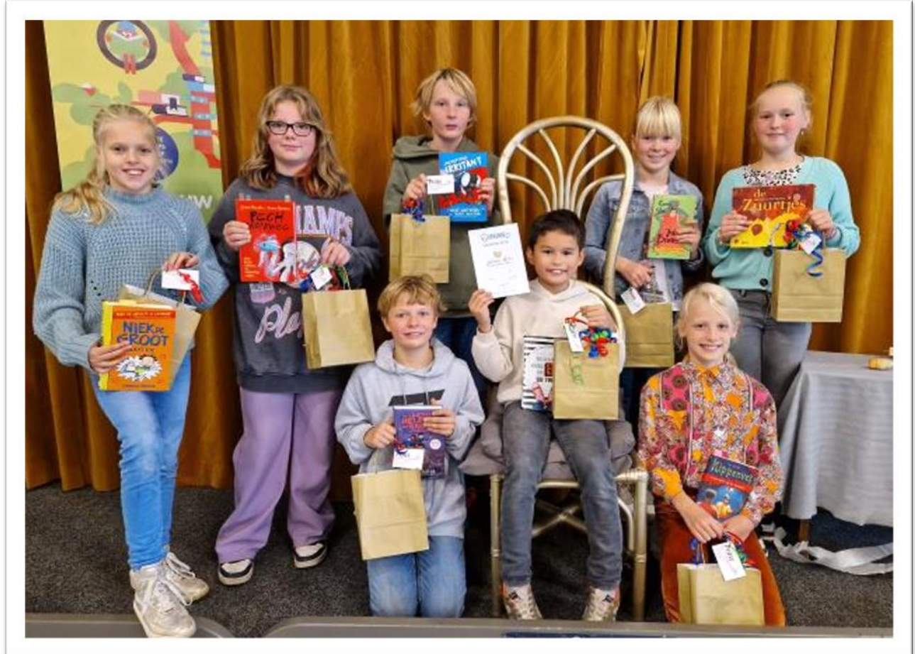
Oktober staat vaak in het teken van de Kinderboekenweek met als terugkerende activiteit: de voorleeswedstrijd