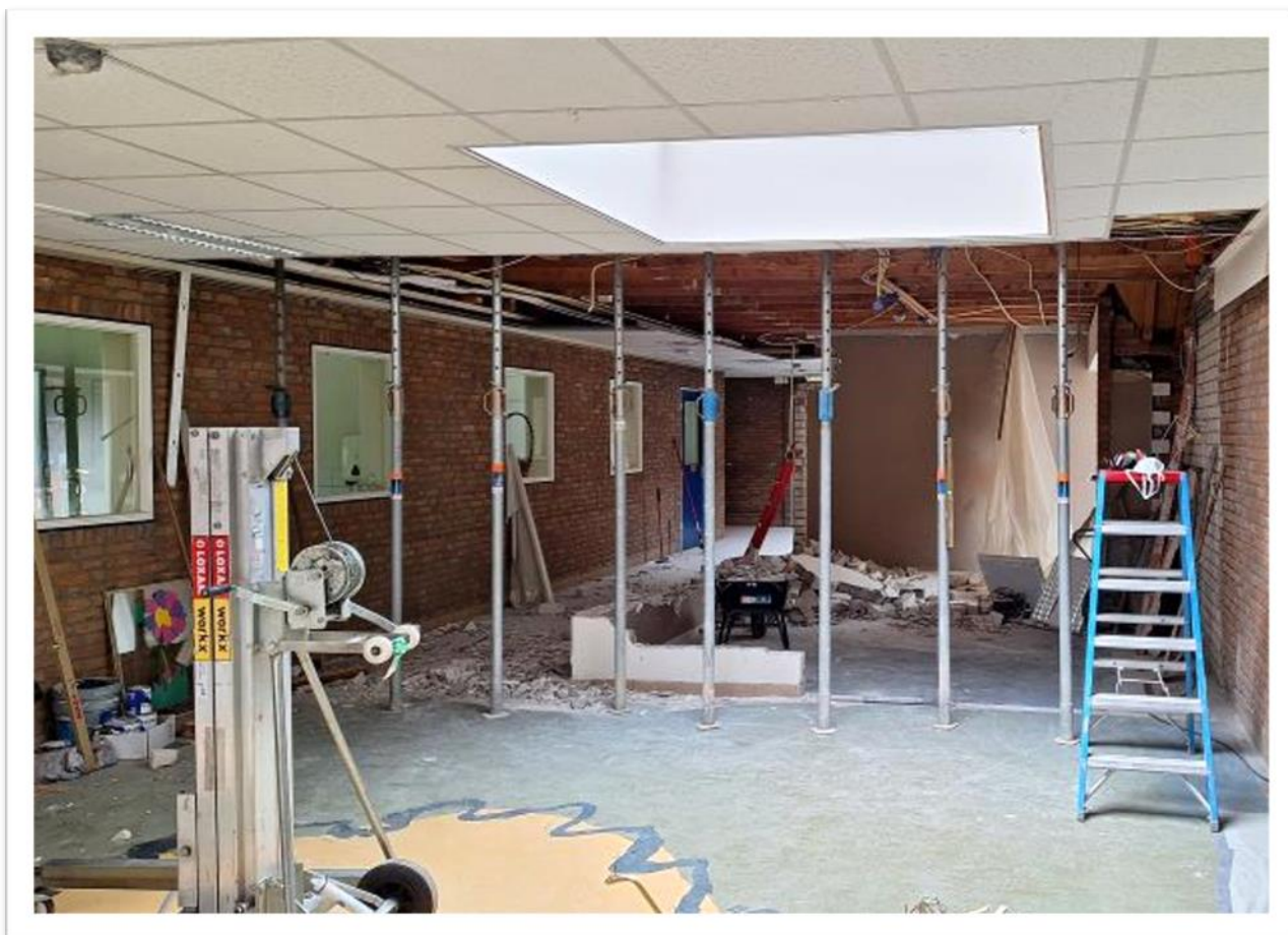
Aan het eind van afgelopen schooljaar is de grote renovatie begonnen van onze school. Muren weg, oud meubilair naar een school in Zimbabwe, vloeren gelegd en nieuwe meubels erin.